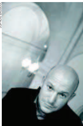
Dror A. Mishani